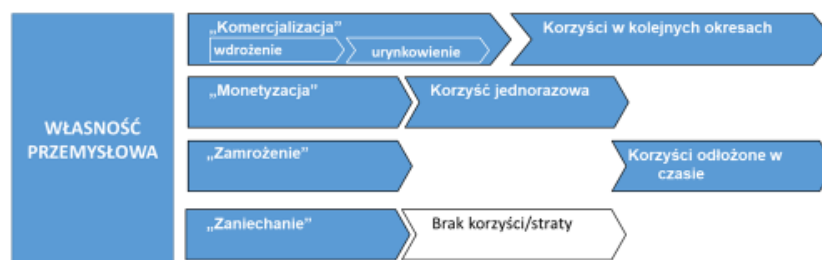
Rys. 3. Model strategii regulacyjnej własności przemysłowej - strategia D IP; źródło: opracowanie własne.

Oddziaływania te wpływają na zachowania uczestników rynku, wymuszając przyjęcie strategicznych postaw. Wśród strategii dotyczących innowacji i jej zarządzania nie występują takie, które znalazłyby pełne odniesienie do możliwości regulacyjnej własności przemysłowej w zakresie oddziaływania rynkowego i wpływu na konkurencyjność. Jak wskazano powyżej chroniona innowacja stanowi odrębny od innowacji niechronionej samoistny byt rynkowy, rządzący się regułami wynikającymi z właściwych regulacji p.w.p. Z tego względu podjęto próbę stworzenia modelu strategicznego wynikającego z założeń obu, ekonomiczno - zarządczego i prawnego, ujęć własności przemysłowej i łączącego cechy każdego z nich. Model Strategii D IP przedstawia się następująco na rys. 3.